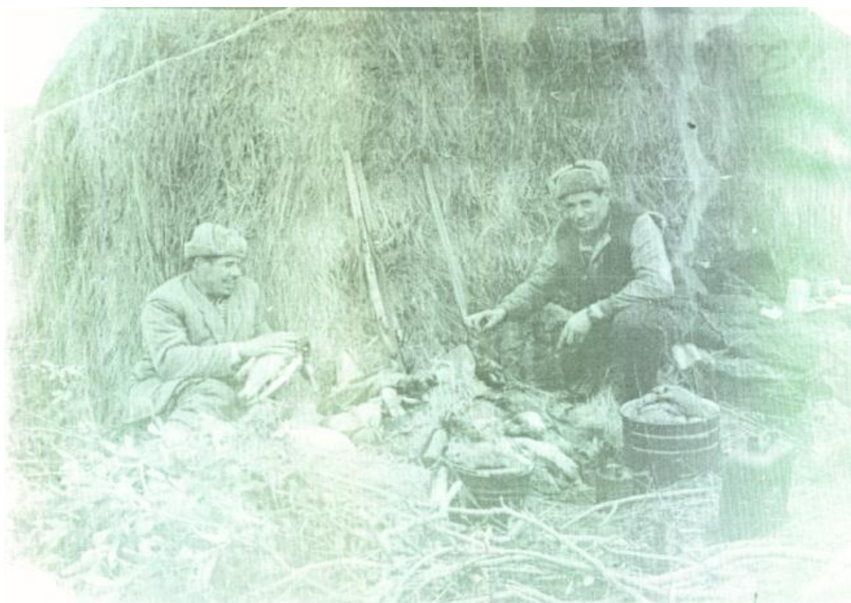
Охотники на привале