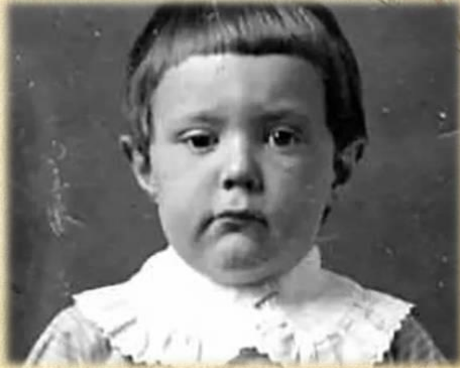
Борис Полевой в детстве

Дата рождения писателя - 17 марта 1908 года. Родился Борис в Москве, но родным городом он считал Тверь, куда в 1913 году 8-летним мальчиком переехал вместе с семьёй. Там прошли его детские и юношеские годы.