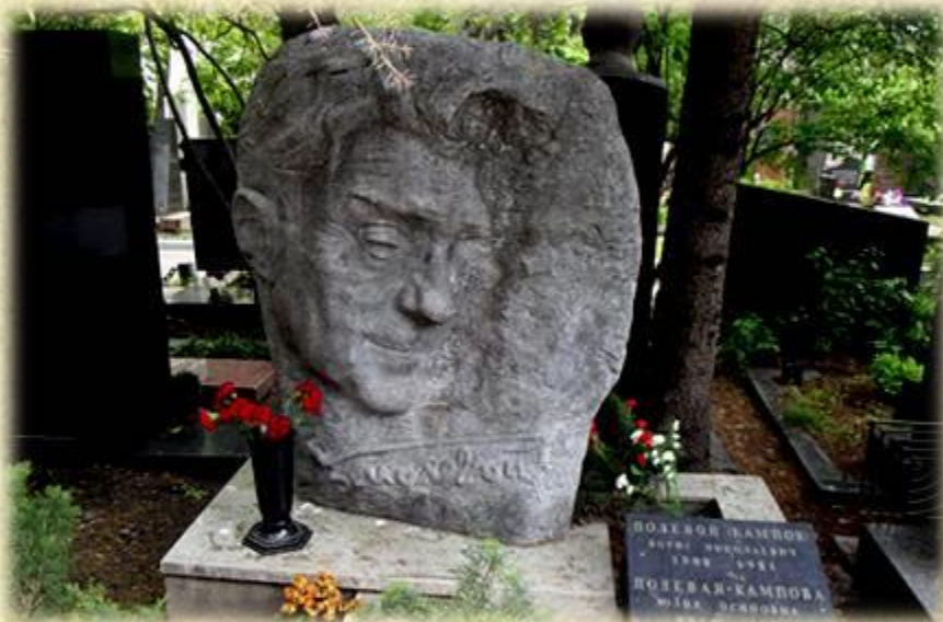
Могила Бориса Полевого

Умер Борис Николаевич Полевой в 1981 году 12 июля и был похоронен на Новодевичьем кладбище в Москве.