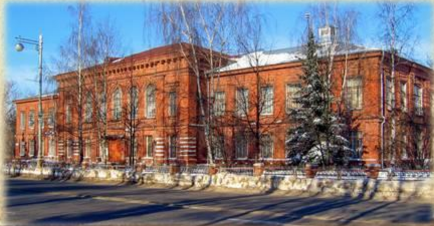
Тверская гимназия №6

Начиная с 1924 года его статьи регулярно появлялись в городских газетах «Пролетарская правда», «Смена» и «Тверская деревня». После окончания в 1926 году промышленного техникума в Твери он работал на местной текстильной фабрике.